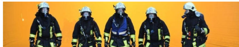
Tunnelübung FF Imy im Allgäu